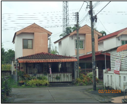
บ้านเดี่ยว 2 ชั้น