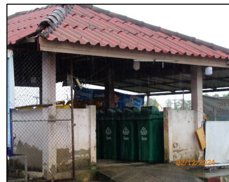
ที่พักขยะภายในโครงการ