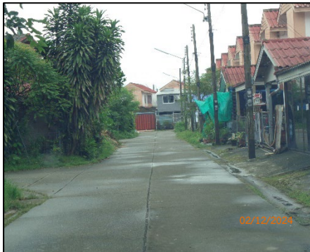
ถนนภายในโครงการ