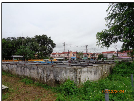
ระบบบำบัดน้ำเสีย