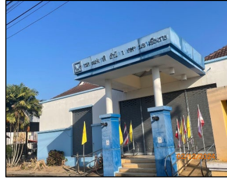
ศูนย์ชุมชน