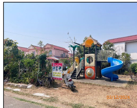
สวนสาธารณะ