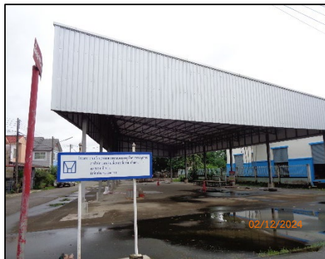
ลานค้าชุมชน