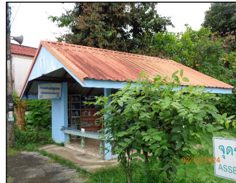
บริเวณห้องสมุดชุมชน